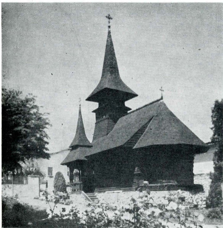
1. Biserica de lemn din Techirghiol.