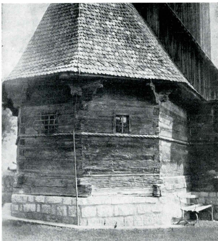
3. Absida bisericii din Olănești-Vîlcea.